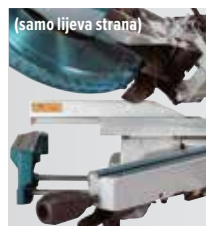
(samo lijeva strana)